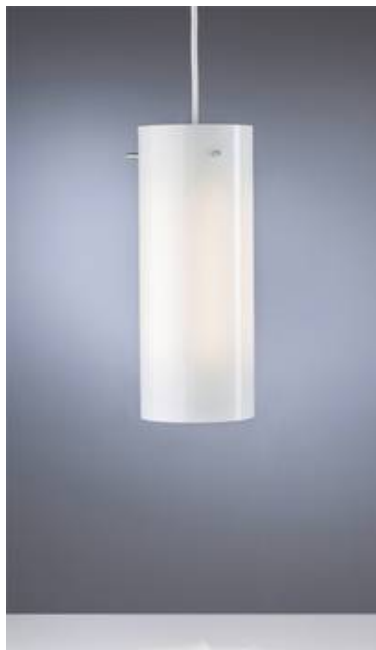
mit Glaszylinder aus Milchüberfangglas

Hier finden Sie unsere aktuellen LED-Modelle