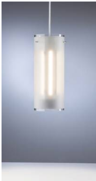
mit teilsandgestrahltem Glaszylinder