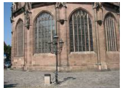
Außenansicht des Kaiserfensters (rechts) im Vergleich zu den anderen Fenstern.