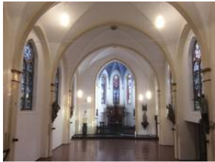
Blick ins Kirchenschiff, nach Osten, NZ