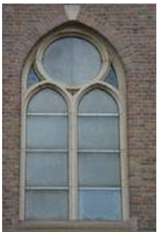
nVII im Vorzustand, die Glasmalereien sind durch die Acrylglasscheiben nicht zu erkennen