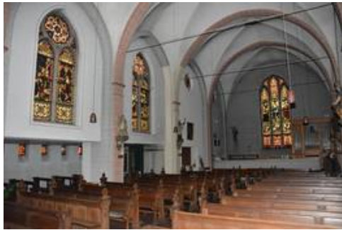
Blick ins Kirchenschiff, nach Westen, VZ

Die Werkstätte in der die Glasmalereien ursprünglich gefertigt wurde ist leider nicht bekannt, auch da die Scheiben nicht signiert wurden. Der Malstil gibt jedoch Anlaß zur Vermutung, dass die Scheiben aus dem Atelier Clayton & Bell stammen könnten, die ab den 1870ern bis ins 20. Jahrhundert Glasmalereien fertigten.