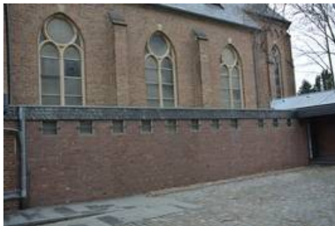
Die Südfassade im Vorzustand mit den Acrylglasscheiben