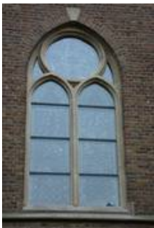
nVII im Nachzustand, auch durch die Schutzscheiben sieht man den Glasmalereischatz