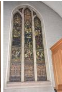
wI im Vorzustand