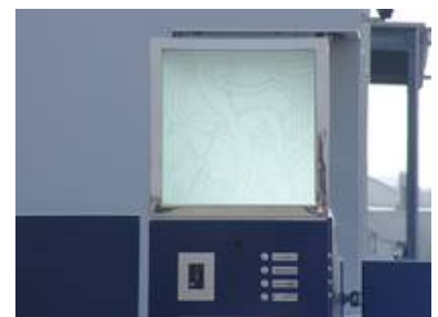
Tiefstrahlarbeit matt in matt für eine Leuchte eines Firmentores