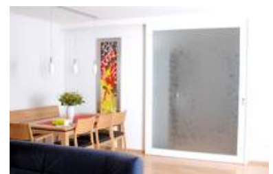
Eine Sandgestrahlte Türscheibe (Sicherheitsglas) in Kombination mit einem Schmelzglasbild in einem Lichtrahmen