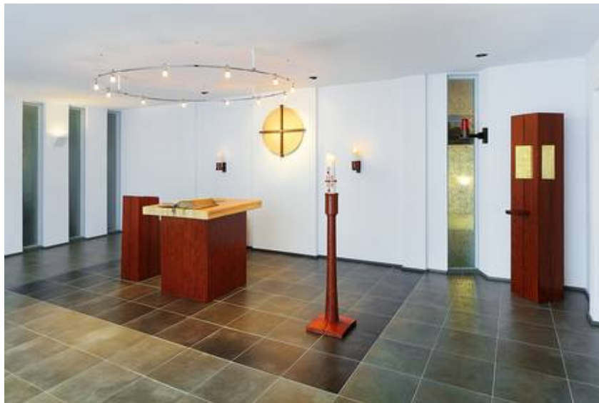
Sandstrahlung mittels Fototransfertechnik nach Entwürfen von Karls Decker für die Hauskapelle im Caritas-Altenzentrum Kardinal-Frings-Haus in Köln