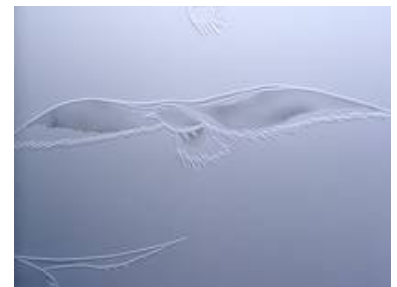
Sandstrahlarbeit matt in matt für ein Privathaus in der Türkei