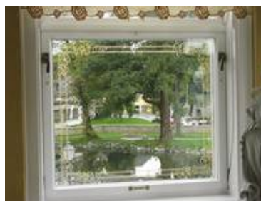
hier in einem sanften gelb eingefärbt.