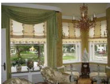
Passend zur Farbstimmung im Raum wurde die Sandstrahlung