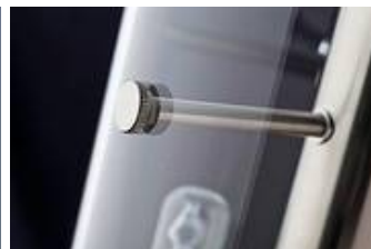
ML 04/P 2-7 mit modifiziertem Glaszylinder