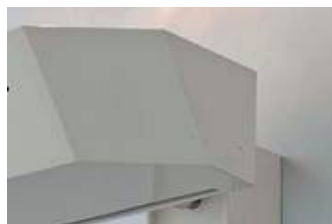
verstellbarer Deckenfluter WM 10/W 7 HIT