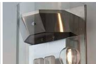
WM 03/W 1T-2g modifiziert mit Zusatzfluter und in Edelstahloberfläche

Um die Details zu diesen neusten Leuchtenmodelle zu sehen, melden Sie sich bitte mit Ihrer E-Mail-Adresse und Ihrer Partnernummer oben rechts auf unserer Internetseite an.