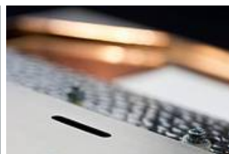
Detail der WM 10/W 8 HIT