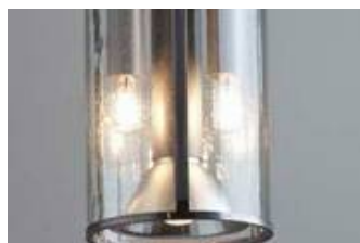
WB 04/P 2-7 mit kleinem Körper