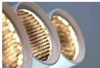
WM 10/W 1-3b mit Blendraster, eines von sechzehn neuen Strahlermodellen