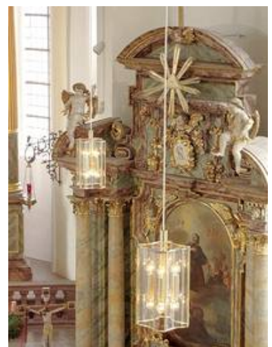
Würzburger Bleileuchten WB 07/P 2-9 hier in Messing in der kath. Kirche Weilbach