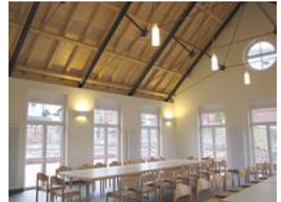
Manufakturleuchten WM 09/P 1 T und WM 94/W 3-2 T im Gemeindesaal in Wenigumstadt