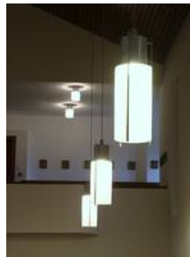
WM 00/P 1 H