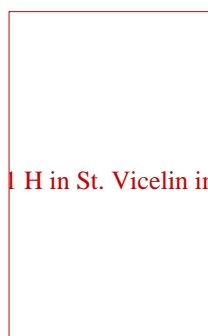
WM 99/P 1 H in St. Vicelin in Lübeck