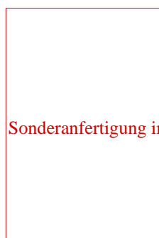
WM 93/P 4-6 als Sonderanfertigung im Kloster Heydau