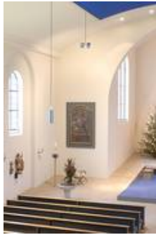
WM 04/P 6-1-2 T und WM 04/P 6-2 in der kath. Kirche St. Nikolaus in Burgoberbach