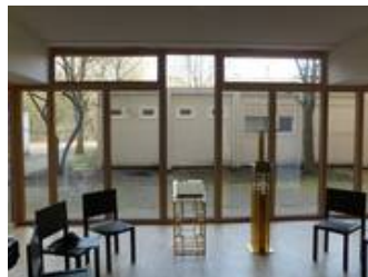
Der Raum vor Montage der Glasgestaltung. Es ist offensichtlich, dass ein Blick durch klares Glas nicht immer meditativ ist...