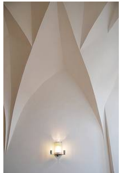
Mit zusätzlichen hocheffizientem Strahler weiterentwickelte Wandleuchte WM 03/W 1T-2 g in der Dompropstei zu Meissen