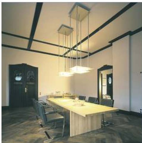
WM 02/DP 6-4 H in einem Besprechungsraum