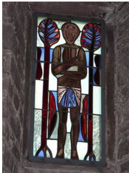
Das gleiche Fenster von Innen im Vorzustand Und im Nachzustand