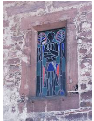
Ein Fenster im Vorzustand