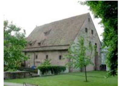
Von Aussen ist St. Aurelius ein unscheinbares Gebäude

Eben jene neun Glasfenster wurden von uns mit einer innenbelüfteten Aussenschutzverglasung versehen; die Glasmalereien wurden restauriert. Auf Grund der besonderen Einbausituation war auch hier eine Sonderlösung für die Schutzverglasung gefragt.