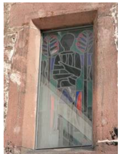
Das gleiche Fenster im Nachzustand mit Schutzverglasung