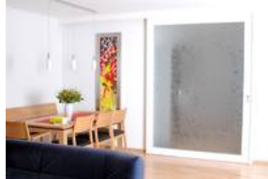
Zwei miteinander kommunizierende Glasgestaltungen von Johannes Schreiber. Eine Sandstrahltür und das Lichtbild mit unserem Flachlichrahmen geben dem Esstisch ein ganz besonderes Flair.

Gerne setzen wir Sie auch Ihr Projekt um, schreiben Sie uns.