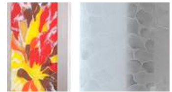
Im Detail erkennt man die Interaktion zwischen Sandstrahlung und Fusingscheibe im Flachlichrahmen