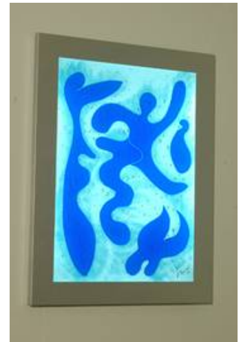
Auch die Lichtbilder in Fusingtechnik von Peter Peppel eignen sich zur individuellen Gestaltung von Räumen ohne Fenster, hier das Motiv Blues