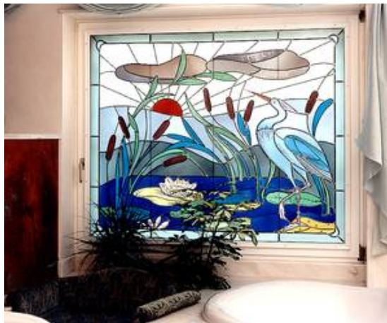
Ein weiteres Beispiel eines etwas anderen Sichtschutzes in einem Badezimmer, hier als Bleiverglasung mit Glasmalerei, Entwurf und Glasmalerei von Curd Lessig

Lassen Sie sich inspirieren auch Ihre Fenster zu gestalten!