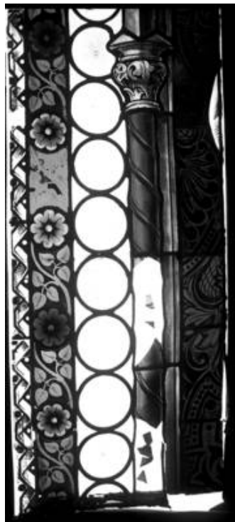
Feld sV 2a