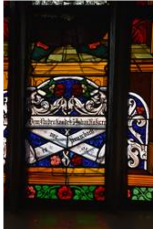
Im Detail zeigen sich in Feld 1b die Schlagschatten durch die Bleiteilung der Schutzverglasung