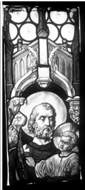
Feld sVI 3b