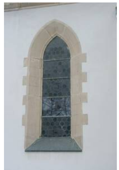
In Steinwiesen wurde selektiv nur eines von fünf Feldern jedes der zehn Schiffensters mit Verbundsicherheitsglas geschützt