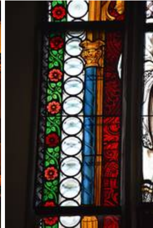
Je nach Glasart fallen die Schatten der Blei im Feld 2a mehr oder weniger auf