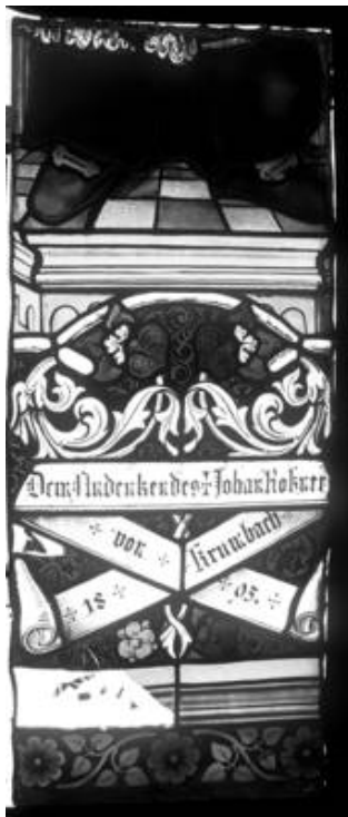
Feld sV 1b