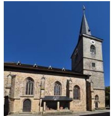
Ein Teil der Südseite der kath. Kirche St. Johannes der Täufer zu Seßlach mit den Fenstern sVII, sVI und sV (v.l.n.r.). In sVI und sV wurden Bleiverglasungen als ASV eingesetzt