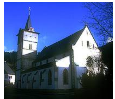
Beispiel einer anderen Lösung in der katholische Kirche St. Marien zu Steinwiesen bei der trotz knappen Budgets unbedingt Verbundsicherheitsglas eingesetzt werden sollte