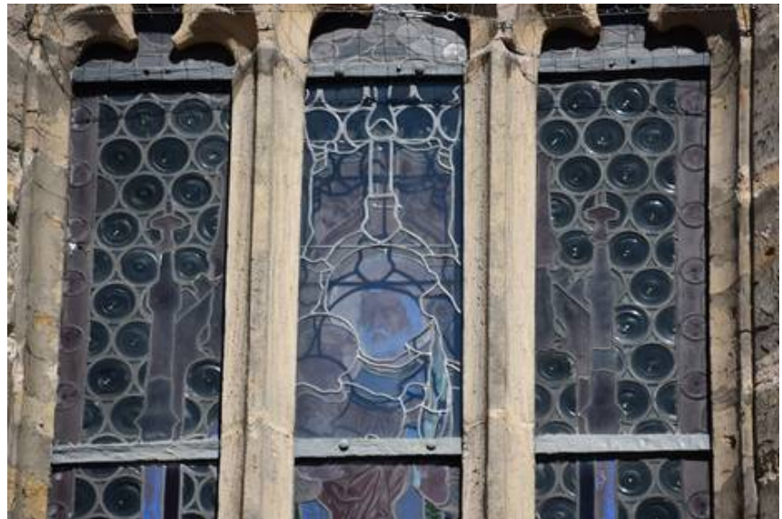
Die Zeile 3 des Fensters im Detail läßt einen guten Vergleich der verschiedenartigen Glasoberflächen zu