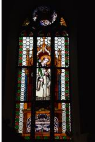
Bei der Gesamtbetrachtung im Durchlicht von innen fällt kaum etwas auf