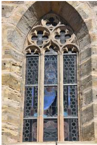
Das Fenster in der Gesamtansicht von außen