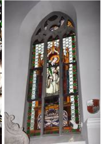
Erst das Auflicht zeigt die nötige Konstruktion