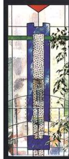
Bleiverglasung mit Siebdruck und Ätztechnik in einer Kanzlei nach Entwürfen von Wladimir Olenburg

Anbei finden Sie einige Beispiel der unterschiedlichsten Objekte.