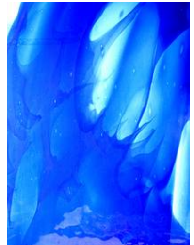
Mundgeblasenes Echt-Antik-Überfanggläser haben eine künstlerische Ausdruckskraft, dass man sie garnicht für eine Bleiverglasung zerschneiden möchte...