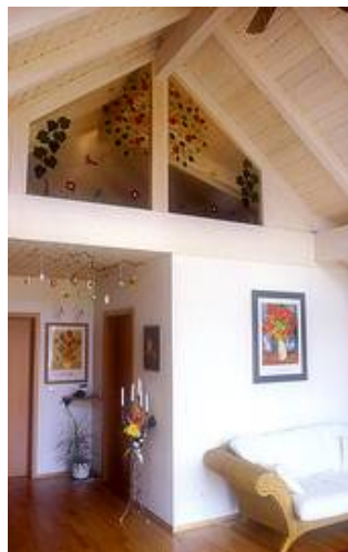
Dachraumabtrennung aus Fusingglas